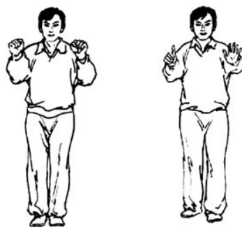
Рисунки 14 и 15