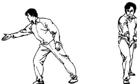
Рисунки 11 и 12

Во время выкрикивания(объявления) команды Ting (остановились!!!! ) поклонитесь и поместите одну вашу протянутую руку между двумя соперниками, с пальцами направленными вверх (рис 11 –12).