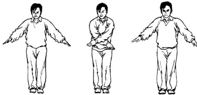
Рисунки 29, 30, 31

25.23 Не имеет силы(не имеющий силы, недействительный). Вытяните обе руки и через их перекрещивание сведите их перед животом (рис 29,30,31).