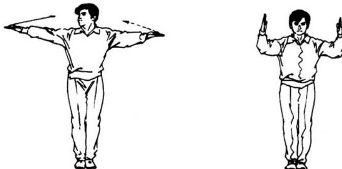
Рисунки 3 и 4

Стоя в центре платформы, вытяните обе руки в стороны, ладони вверх, указывая ими на участников (рисунок 3). Как только звучит им команда взойти на ринг – согните в локтях обе руки под прямым углом, ладони(располагаются) напротив друг друга. (рис 4).